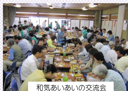
和気あいあいの交流会