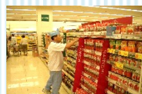
スーパー品出・商品管理