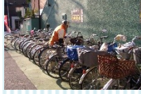
駐輪・駐車場の整理