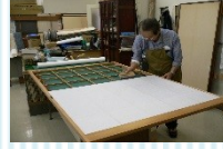
障子・襖・網戸張替