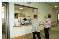
公共施設の受付・管理

シルバー人材センターは、公共・企業・家庭から請けた仕事を会員のみなさんに提供します。