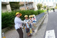
通学路の安全指導