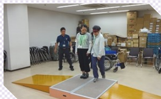
「地域活動コース」福祉の現場を体験 (8/23)

4 コース合同の 「共通講座」 元滋賀県知事 國松善次氏の講演 “100 歳人生を考 える” (7/10)